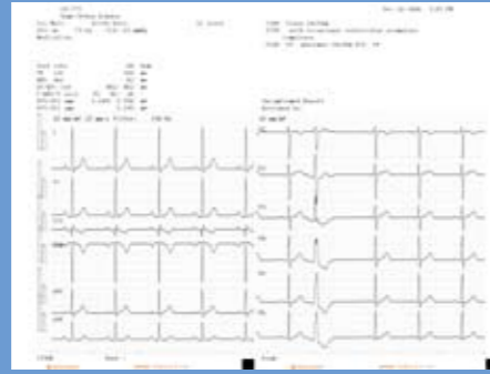
12-Kanal-EKG, 6 Kurven, Analyse-Ergebnisse (eingestellte + autom. Verstärkung)