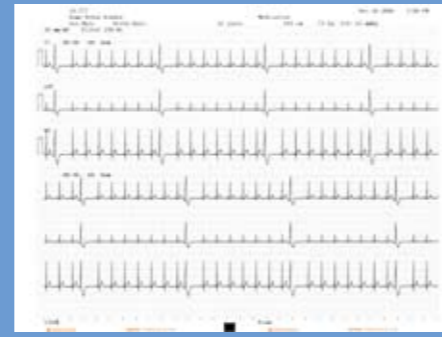
1- oder 3-kanalige Rhythmus-aufzeichnung