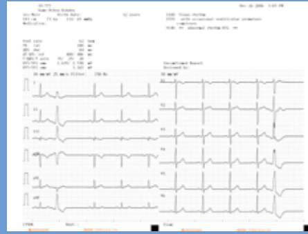
12-Kanal-EKG, 6 Kurven, Analyse-Ergebnisse (autom. Verstärkung)