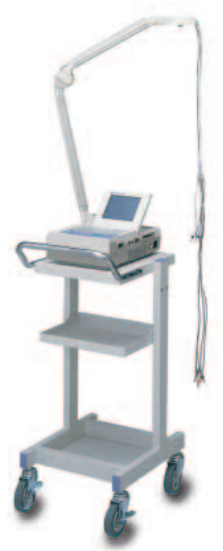
CARDIOFAX Q ECG-9132 mit KD-104E, DI-106D und KH-801E